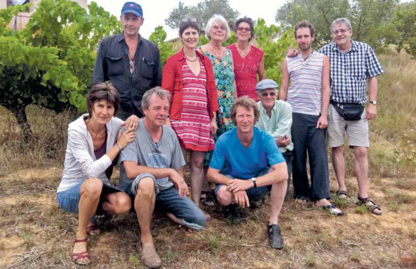
Des collaborateurs et collaboratrices du FCE à leur rencontre semestrielle. Dans l'année 2015, la mise en place d'un réseau transfrontalier était une bonne base pour faire face aux nouveaux défis.