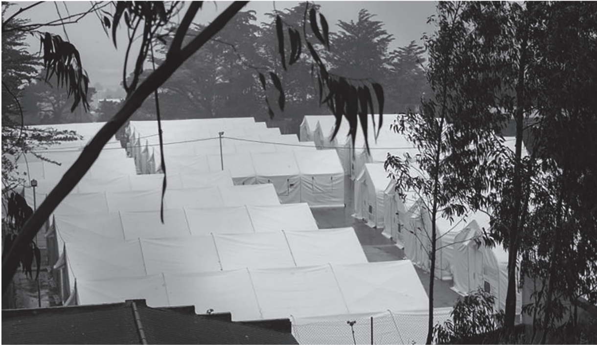
Macrocentro «Las Raices» im Nordosten von Teneriffa (Spanien). Heftige, vermeidbare Überschwemmung durch Regen im Dezember 2021.

Zeitung des Europäischen BürgerInnenforums