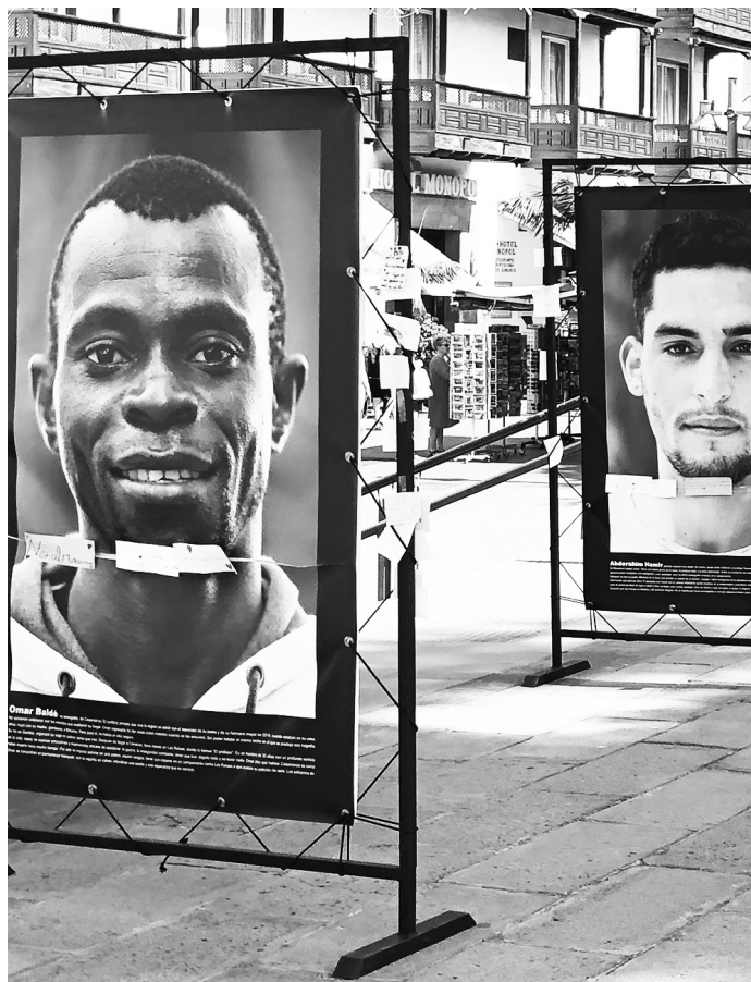
Nach einem Anschlag auf eine Ausstellung mit Porträts von Geflüchteten, reparierten Schüler-innen am Morgen danach die Risse in den Leinwänden.